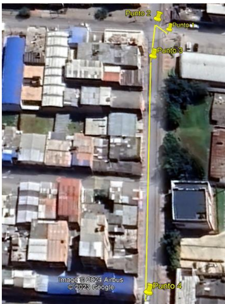
Ilustración 1. Recorrido verificación ambiental

Se realizó recorrido de control y vigilancia en el cuadrante 1, barrio SAMARKANDA el día 23 de mayo del 2024, desde las coordenadas 4°42'40,692"N- 74°12'11,466"W hasta las coordenadas 4°42'39,276"N- 74°12'14,568"W (ver ilustración 1. Ruta amarilla), con el fin de verificar las condiciones ambientales, identificar posibles afectaciones a los recursos naturales y realizar las acciones de prevención correspondientes.